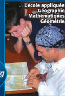
L'école appliquée: Géographie, Mathématiques, Géométrie.

L'enseignement académique est individualisé selon la méthode de la formation aux adultes qui permet de tenir compte des particularités des élèves de 14 ans et plus. Ça n'est ni un travail "solitaire", ni un enseignement particulier, même si le formateur est disponible pour chaque élève.