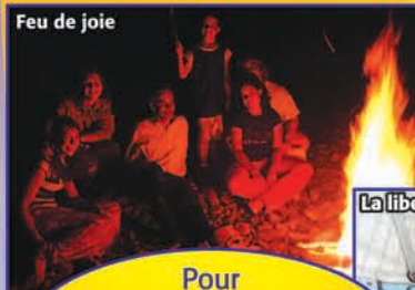
Feu de joie

Un grand potentiel dort en chacun de nous, comme dormait l'intelligence dans l'homme de Cromagnon. Mais ce potentiel est prisonnier des actions nuisibles que l'humanité a perpétrées depuis la nuit des temps. Voilà enfin la possibilité de racheter votre lettre de pardon en tant que corsaire. À travers cette mission, vous devrez aussi retrouver les objets qui révéleront le pouvoir qui dort en vous.