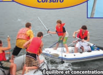
Équilibre et concentration