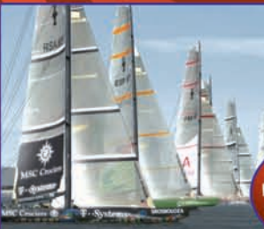
Course sur Virtual Skipper

Et si le vent s'absente sur un lac miroir ? Et bien se sera une invitation à la baignade !