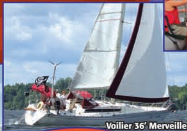
Voilier 36' Merveille

Pour en savoir plus: www.fondationcorsaro.org section: Camps de voile